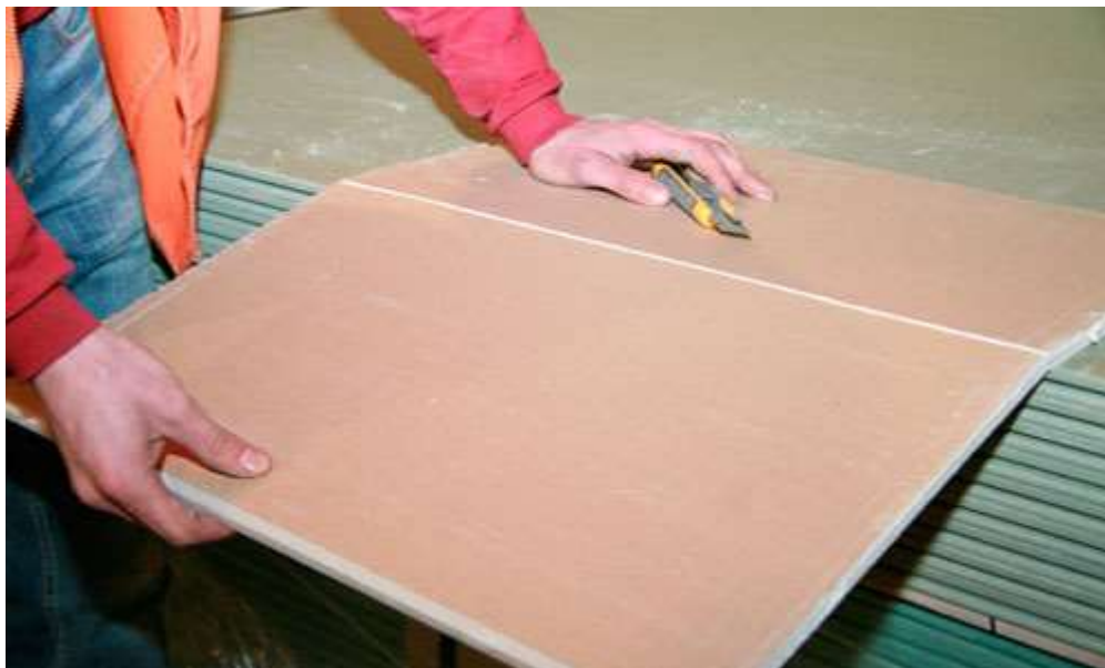
Рисунок 2 – Разрезание листов

Лицевой картон разрезают, гипсовая сердцевина ломается при повороте плиты по линии реза, после чего разрезают картон с обратной стороны листа.