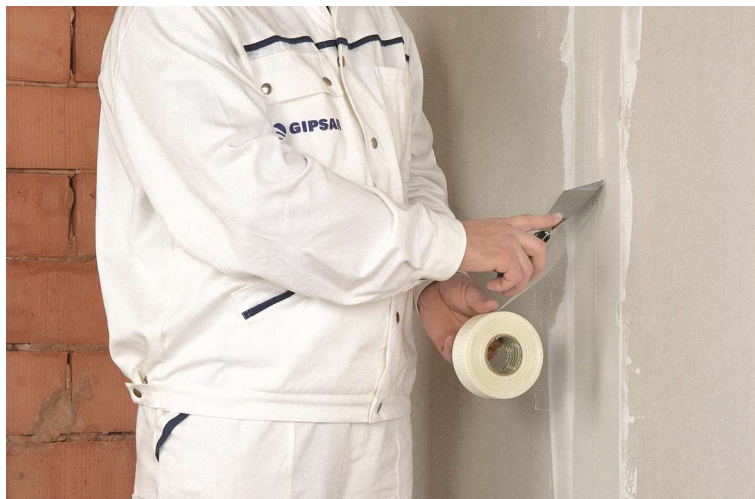
Рисунок 4 – Заделка швов

При заделке швов между листами наносят клеевой состав «Люкс» или «Тайфун Мастер» № 16, в который затем втапливают армирующую ленту шпателем или металлической теркой и выравнивают заполнение шва до проектного положения в соответствии с рисунком 4.