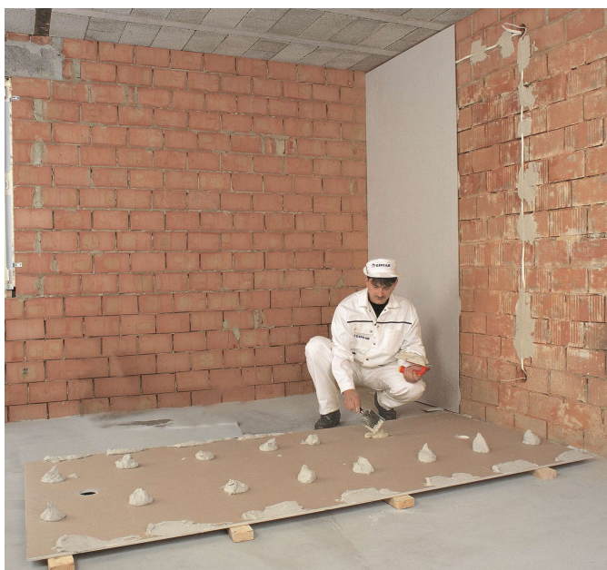
Рисунок 3 – Нанесение клеевого состава на лист

Шов между сложными стыкуемыми листами не должен превышать 2 мм.