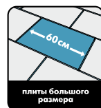
плиты большого размера