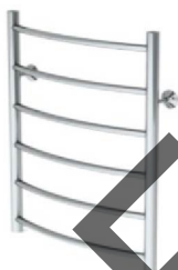
Рис.1 Лесенка Л (нижнее подключение)