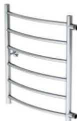
Рис.1 Лесенка ЛБ (боковое подключение)

Структура условного обозначения с указанием размеров: